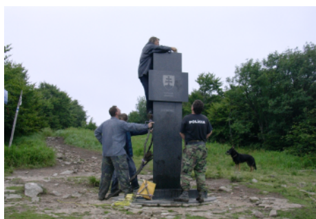
Osádzanie antény GPS na trojštátnom znaku Kremec.

Geodetický a kartografický ústav Bratislava www.gku.sk