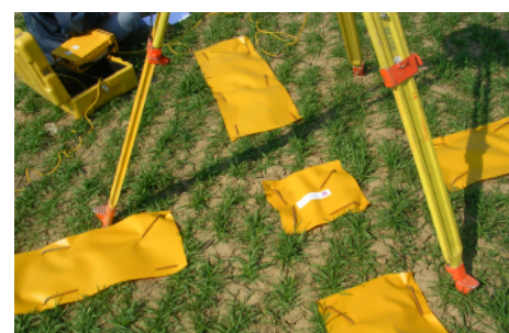
Vlícovací bod signalizovaný fóliou so štyrmi ramenami.