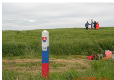
Hraničné stĺpy po údržbe.