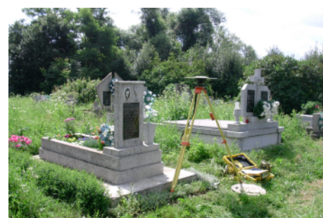
Meranie nesignalizovaného vlícovacieho bodu.

Medzinárodná konferencia k vývoju územnosprávneho členenia a štátnych hraníc pri príležitosti 100. výročia vzniku Československej republiky Bratislava 18. - 19. október 2018