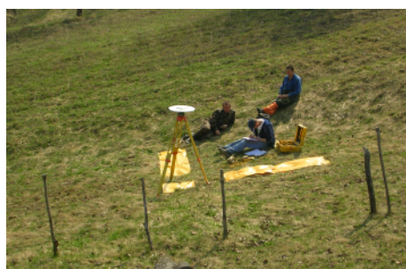
Zameranie vlícovacieho bodu s dvoma ramenami.