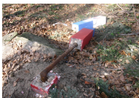
Poškodený hraničný stĺp po páde stromu.