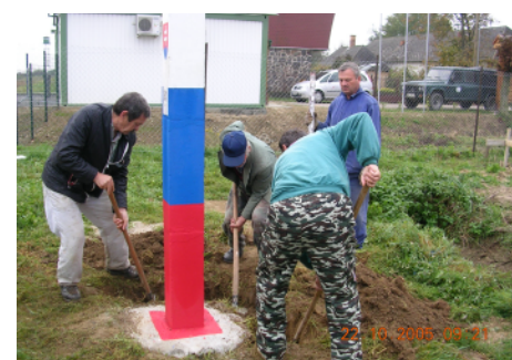
Prestabilizácia hraničného stĺpu vo Veľkých Slemenciach.