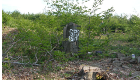
Volba nesignalizovaného vlícovacieho bodu.